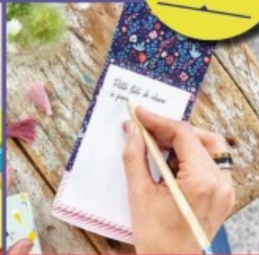
LES BLOCS-NOTES ILLUSTRÉS