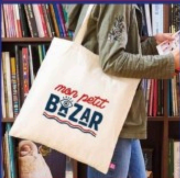
LES SACS TOTE BAGS