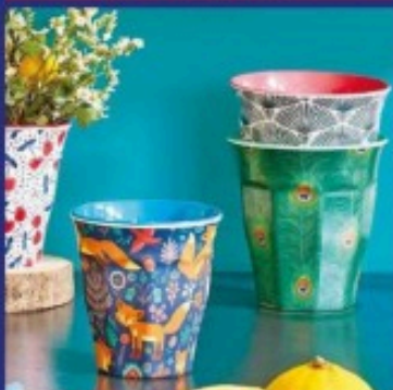
LES GOBELETS TIMBALE