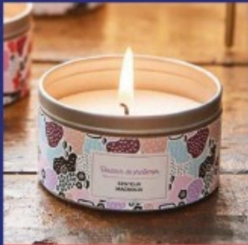
LES BOUGIES COSY