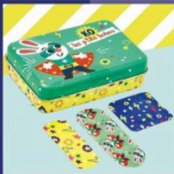
LES BOÎTES À PANSEMENTS