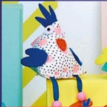
LES PORTE-CLÉS COKETTES